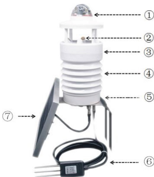
Рисунок 1 – Внешний вид метеостанций IMETEOLABS PWS

Метеостанция выполнена в пластмассовом корпусе. Внешний вид метеостанции IMETEOLABS PWS представлен на рисунке 1.